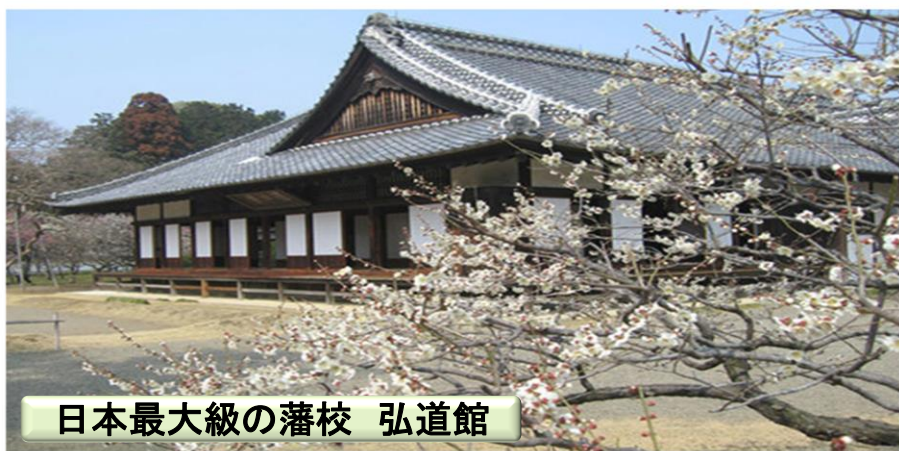
日本最大級の藩校 弘道館