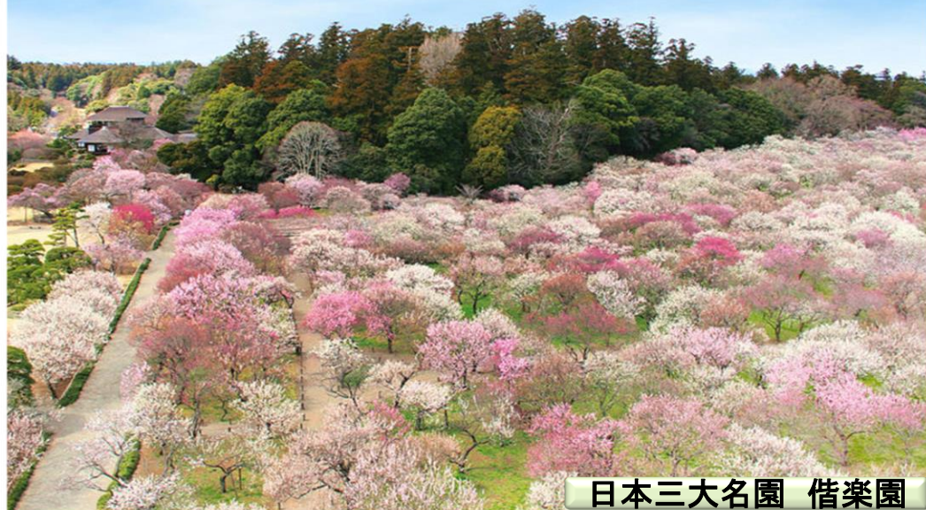
日本三大名園 借楽園