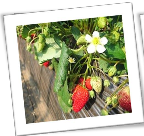
深作農園のいちご