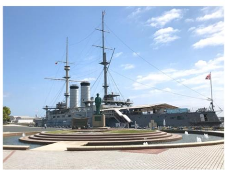
記念館三笠 (各自払い・自由見学)